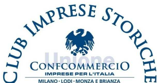
Logo del Club Imprese Storiche che verrà sostituito.

Il nuovo marchio dovrà sostituire il logo utilizzato attualmente, che consiste nel logo di Confcommercio Milano Lodi Monza e Brianza con l'aggiunta della dicitura Club Imprese Storiche , illustrato di seguito: